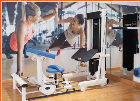
Getrennter Trainingsbereich (Lady-Fitness)