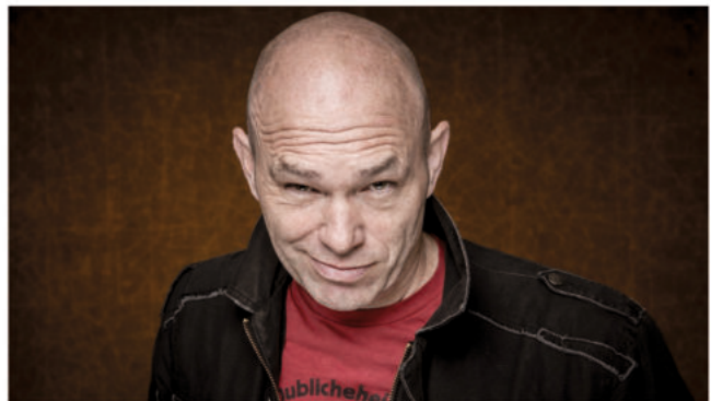
„StadtHausSterne“ mit Comedian Heinz Gröning

Kartenvorverkauf: Bleich Drucken und Stempeln, Braunschweiger Str. 2, Tel.: 05136 - 1862, und www.reservix.de