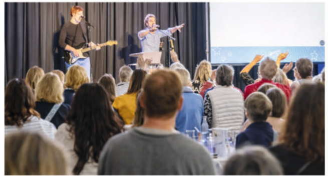
3. Burgdorfer Rudelsingen im StadtHaus

Veranstaltungszentrum StadtHaus, Sorgenser Str. 31 Veranstalter: www.rudelsingen.de Kartenvorverkauf: Bleich Drucken und Stempeln, Braunschweiger Str. 2, Tel.: 05136 - 1862, und www.reservix.de