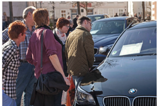
Verkaufsoffener Sonntag mit Mobilitäts-Frühling

Innenstadt Veranstalter: Stadtmarketing Burgdorf (SMB), Tel. 05136 – 972 1418