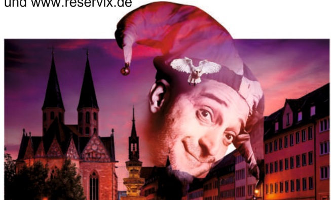
Schauspiel „Till Eulenspiegel“ im Theater am Berliner Ring

Schauspiel von Moritz Nikolaus Koch nach der gleichnamigen Volkssage Theater am Berliner Ring Veranstalter: VVV + Stadt Burgdorf Kartenvorverkauf: Bleich Drucken und Stempeln, Braunschweiger Str. 2, Tel.: 05136 – 1862, und www.reservix.de