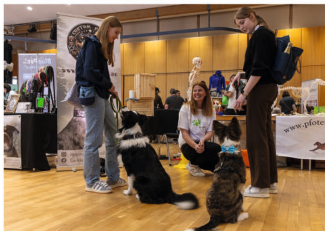
4. Burgdorfer Hundemesse im StadtHaus

Ein weiterer interessanter Anlaufpunkt ist der Stand der „BRH Rettungshundestaffel Hannover, Harz und Heide“, an dem die Besucher erfahren, wie die Spezialausbildung von Hunden abläuft, deren spätere Aufgabe es ist, Menschen aus Gefahrensituationen zu befreien und ihr Leben zu retten. Dass unvorbereitet auftauchende Tierarztkosten gerade bei einer Operation oft erhebliche Einschnitte im finanziellen Budget verursachen, dürfte eine von vielen Hundebesitzern geteilte leidvolle Erfahrung sein. Eine Möglichkeit, dieses Risiko abzufedern, bildet der Abschluss einer Tierkrankenversicherung. Ihre darauf abzielenden Angebote stellen zwei Versicherungsgesellschaften auf der Messe vor.