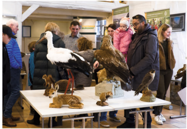
Ausstellung der Jägerschaft Burgdorf

Veranstalter: VVV + Förderverein Stadtmuseum + Stadt Burgdorf - Tel.: 051363 - 1862