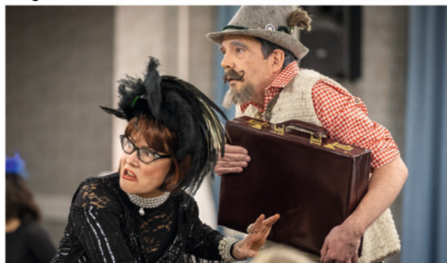
Krimi-Dinner im StadtHaus