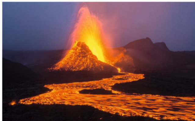
3D-Diashow über Naturwunder des Nordens

Der Fotograf Stephan Schulz lädt in seiner Diashow „Island & Grönland – Naturparadiese des Nordens“ das Publikum ein, in eine faszinierende 3D-Bilderfolge einzutauchen. Dabei erwartet die Zuschauer ein plastisches visuelles Erlebnis, das einen einzigartigen Charakter im Bereich der Live-Reportage im deutschsprachigen Raum aufweist. Die Diashow ist am Montag, 19. Januar 2026, um 19.30 Uhr im Veranstaltungszentrum StadtHaus (Sorgenser Str. 31) zu sehen. Gastgeber sind das StadtHaus und der VVV. Eintrittskarten gibt es bei Bleich Drucken und Stempeln, Braunschweiger Straße 2, Telefon 05136 – 1862. VVV-Mitglieder erhalten Ermäßigungen.