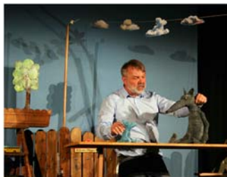
Puppenwelten im Stadtmuseum

Neues“ vom 8. März bis 17. Mai. In der KulturWerkStadt (Poststr. 2) sind die Ausstellungen "Unsere heimische Tierwelt - präsentiert vom Infomobil der Jägerschaft Burgdorf" (11. Januar bis 22. Februar) und "Kinderrechte" (8. März bis 6. April) zu sehen. Öffnungszeiten in beiden Museen: sonntags von 14 bis 17 Uhr.