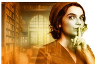
Agatha Christie-Musical am 30. Januar

Am 13. Februar 2026 um 20 Uhr folgt „Till Eulenspiegel“ als lebendige Schauspielfassung des niedersächsischen Klassikers. Der berühmte Schelm erscheint als kluger, rebellischer Spiegel der Gesellschaft – mal derb, mal poetisch, stets mit spitzem Witz. Ein turbulentes Volkstheater-Erlebnis für alle Generationen.