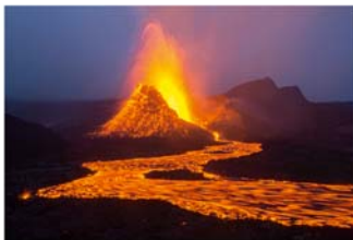
3D-Diashow über Naturwunder des Nordens