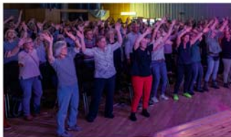
3. Burgdorfer Rudelsingen im StadtHaus

stürmen will – bei diesem Konzert-erlebnis darf jeder mitmachen und sich einen Abend lang in der Musik und im Gesang verlieren. Das Motto lautet: Ob laut oder leise – hier zählt nur die Freude am Singen! Für das Burgdorfer Konzert stellen die Veranstalter ein buntes Programm mit legendären Songs und Evergreens neu zusammen und überraschen die Teilnehmer mit vielen neuen Lieblingsstücken. Wer noch nie beim RUDELSINGEN dabei war, kann unbesorgt sein – Vorkenntnisse sind nicht nötig und die gemeinschaftliche Gesangsfreude lässt den Funken sofort überspringen.