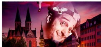
Schauspiel „Till Eulenspiegel“ im Theater am Berliner Ring