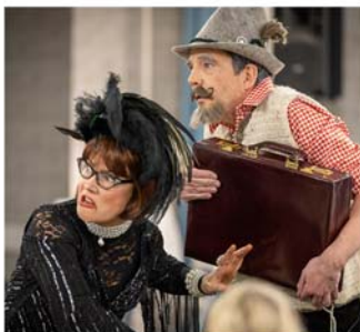
Krimi-Dinner im StadtHaus

Tommaso De Rose Iffezheimer Weg 18 30853 Langenhagen