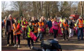
„Burgdorf putzt sich raus!“ am 7. März

Interessierte Gruppen und Einzelpersonen werden gebeten, sich frühzeitig unter vvvburgdorf@aol.com oder telefonisch unter 05136-1862 anzumelden. Gegen 12.30 Uhr endet die Aktion wieder am Pferdemarktplatz – mit einem vom VVV organisierten Imbiss zur Stärkung aller Helferinnen und Helfer.