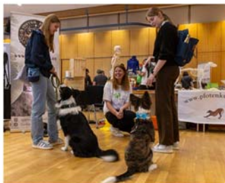
4. Burgdorfer Hundemesse im StadtHaus

angeboten vor. Zahlreiche Aussteller präsentieren sich auf der Messe mit ihren aktuellen Produkten, Dienstleistungen und Trends rund um das Hundewohl und eine artgerechte Hundehaltung.